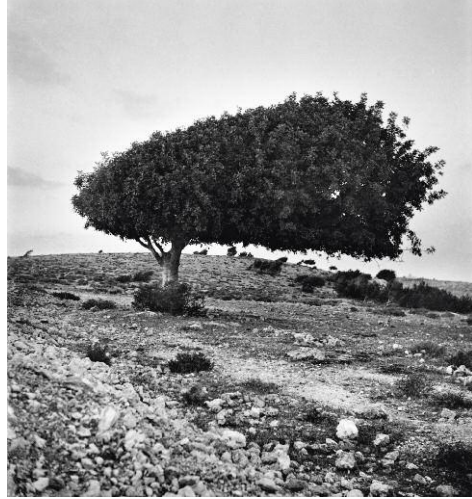
8 Sycamore Tree, Sinai Desert, 1973