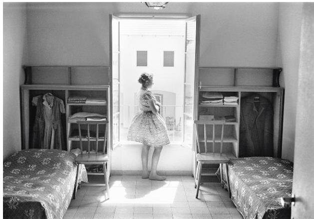
9 A Room in Kfar Batya for Child Survivors of the Holocaust, Ra'anana, 1947