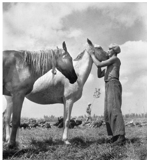
12 Horses, Giv'at Haim, 1941