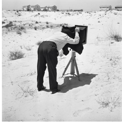
2 A Photographer on the dunes, 1962 © Rudi Weissenstein