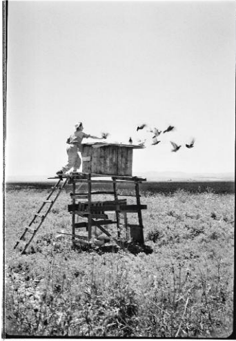
7 Farmer, Afula, 1950 © Rudi Weissenstein