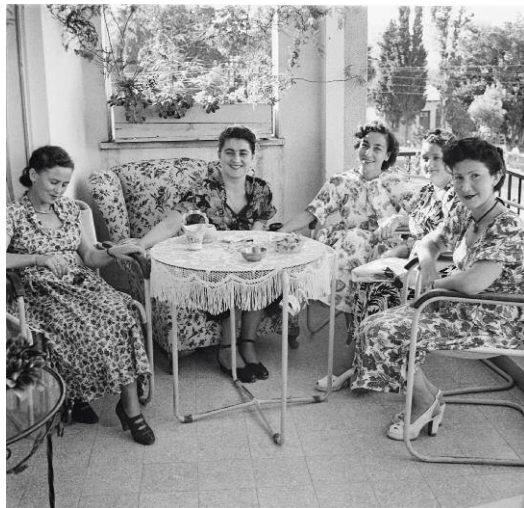
10 Reception at Polish Consul's Home, Tel-Aviv, 1948