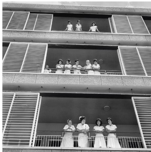
6 Hospital, Beer-Sheva, 1963