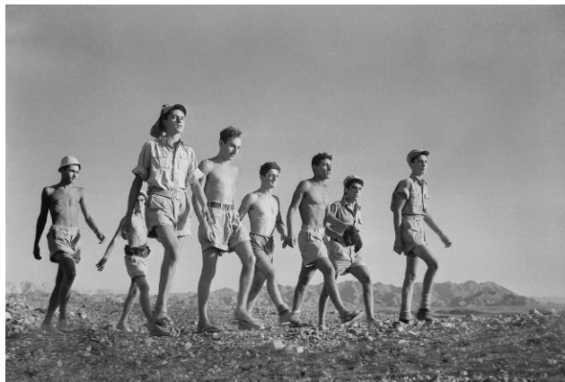
11 Youth, Eilat, 1949