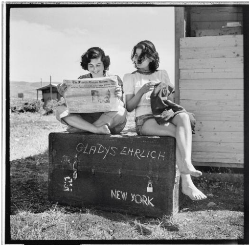
3 New Immigrants, Kibbutz HaSolelim, 1950