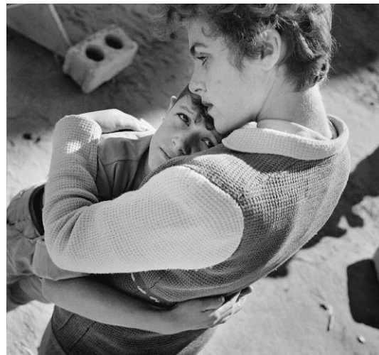
4 Film Studios, 1952